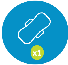
Комплект многоразовых менструальных прокладок