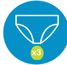
Женское нижнее белье