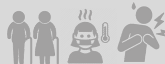
Шумораи баландтарини ҳолатҳои фавт дар байни калонсолон ва шахсони мубталои бемориҳои дигар рух дода истодааст.

Барои тасдиқи маълумот оид ба фарқиятҳои синнусоли маълумоти дақиқ ва фарогир аз рӯи ҷинс зарур аст, зеро шадиднокии сироят аз синну сол (аз 60 сола боло) ва шароити муҳит вобаста аст. Масалан бемории ВНМО дар байни калонсолон, хусусан занон масъалаест, ки аз мадди назар дур мондааст ва дар натиҷа бо чораҳои мубориза фаро гирифта намешавад. Аз ин лиҳоз, дар асоси сабақҳои аз дигар бемориҳои сироятӣ омӯхташуда ба ниёзи занони калонсол диққати аввалиндараҷа додан зарур аст.